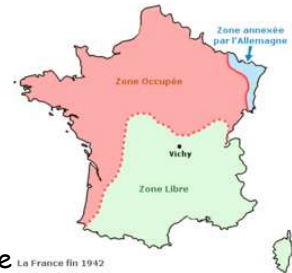
File d'attente La France fin 1942 Les 2 zones en France en 1940