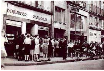
devant une boulangerie

En 1940, l'Armistice est signé. L'armée allemande occupe la moitié Nord de la France ( la zone occupée ). L'armée réquisitionne tout, les français manquent de tout ( nourriture, vêtements, charbon .. ), vivent dans la terreur des arrestations, des bombardements et des exécutions. C'est la période d'Occupation.