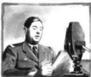
Le Général de Gaulle , appel du 18 juin 1940

Les résistants ont joué un rôle essentiel dans la Libération de la France