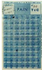
Ticket de rationnement