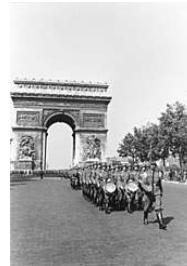
Troupes allemandes devant l' Arc de Triomphe en 1940