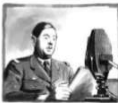
Général de Gaulle

Nous avons été, nous sommes submergés par la force mécanique, terrestre et aérienne de l'ennemi. Mais le dernier mot est-il dit ? La défaite est-elle définitive ? Non, croyez-moi, moi qui vous parle en connaissance de cause et vous dis que rien n'est perdu pour la France. Car la France n'est pas seule. Elle peut faire bloc avec l'Empire britannique qui tient la mer et continue la lutte. Moi, j'invite les officiers et les soldats français, j'invite les ingénieurs et les ouvriers à se mettre en rapport avec moi. Quoiqu'il arrive, la flamme de la résistance ne doit pas s'éteindre.