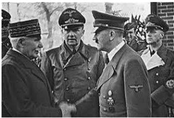
Hitler et le Maréchal Pétain

Le Maréchal Pétain accepte les exigences des nazis, fournit du matériel aux allemands, fait arrêter les opposants et fait déporter 76 000 juifs dans des camps de concentration. C'est ce qu'on appelle la Collaboration.