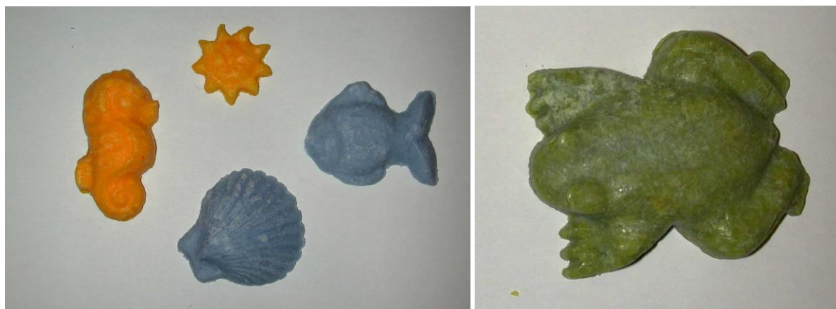
Exemples de réalisations pour les plus petits

Quand la pâte a la consistance de la pâte à modeler, presse, couleur par couleur, tes savons dans leur moule. Quand le moule est rempli, bien tassé, retourne-le et tapote-le sur la table recouverte d'un torchon pour amortir les chocs : le savon moulé tombe tout seul. Mets alors tes savons à sécher dans un endroit sec et chaud (par exemple au dessus d'un radiateur) une semaine environ avant de l'emballer dans du papier de soie pour l'offrir à ta Maman.