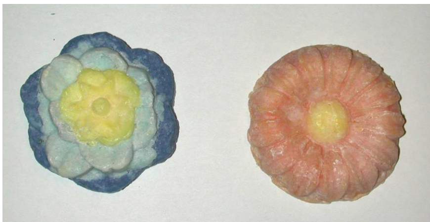
Pour les plus grands, des savons multicolores

Que faire de ces petits savons ravissants qu'on glane dans les hôtels ? Voici une idée cadeau idéale pour la fête des mères ! Réalisable avec des enfants en bas âge dès 3 ans (sauf le broyage en mixer bien entendu qui se fera avec l'aide de Papa).