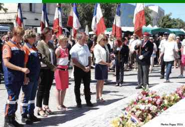
Dépôt de fleurs et recueillement des Mérignacais