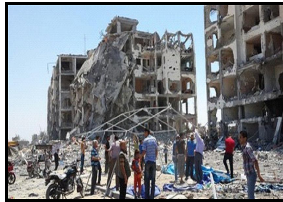
L'Etat terroriste d'Israël assassine les Palestiniens

Nous condamnons à Gaza et en Palestine avec toute fermeté cette nouvelle attaque meurtrière contre le peuple français.