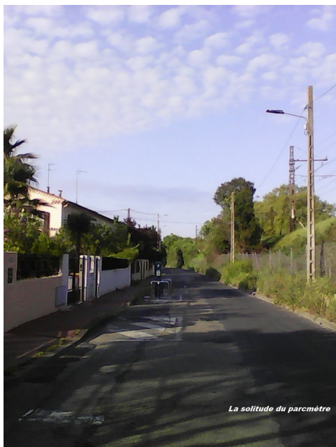
La solitude du parcimètre