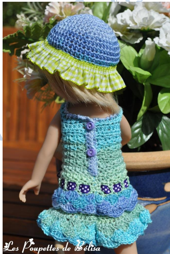
Les Poupettes de Bélisa

Coudre 2 boutons en vis-à-vis des boutonnères.