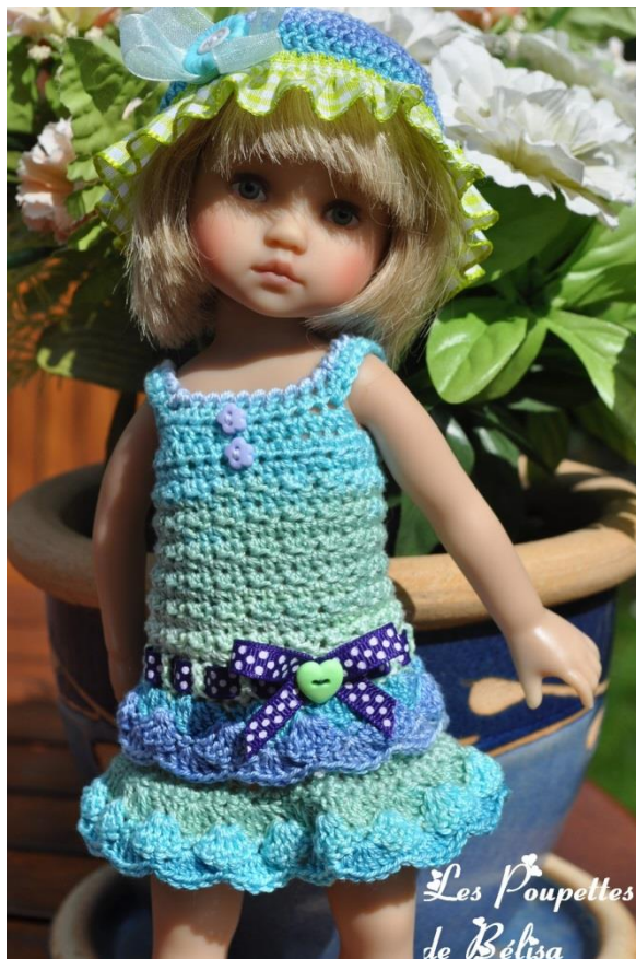
Les Poupettes de Bélisa

Fermer le bas du dos de la robe sur une hauteur d'environ 5 cm. Confectionner 2 pattes de boutonnage de 2 rgs de ms sur chaque dos en répartissant 2 boutonnères de 1 (2) m sur l'un d'eux. Coudre les pattes de boutonnage l'une sur l'autre