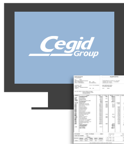
BULLETIN DE PAIE (Code du travail)