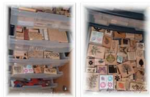
Les outils préférés d'Anice : ses tampons