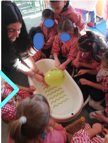
Moi dans mes pratiques universitaires

J'ai étudié beaucoup choses, je suis guide touristique (je n'ai jamais travaillé de ça) et je suis Éducatrice Infantile. Maintenant, je fais des études d'Éducation Infantile à l'Université d'Oviedo, je fais la quatrième année, et aussi je travaille de moniteur de PROA avec des garçons et des filles de cinquième année de primaire.