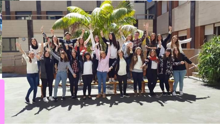
Ma classe de guide