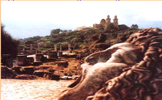
Hippone : ruines et église St Augustin