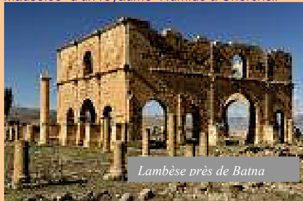
Lambèse près de Batna