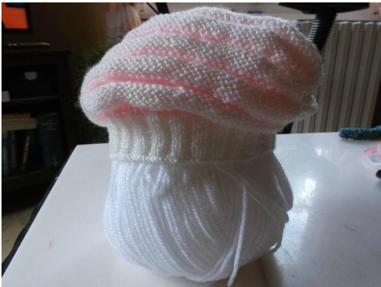
le travail fini