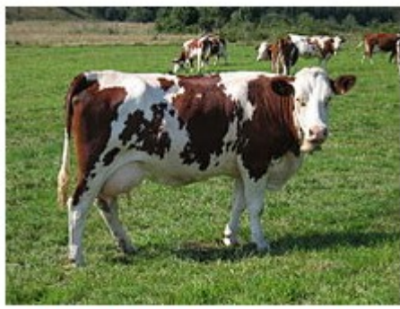
La montbeliarde est une race bovine franc-comtoise.