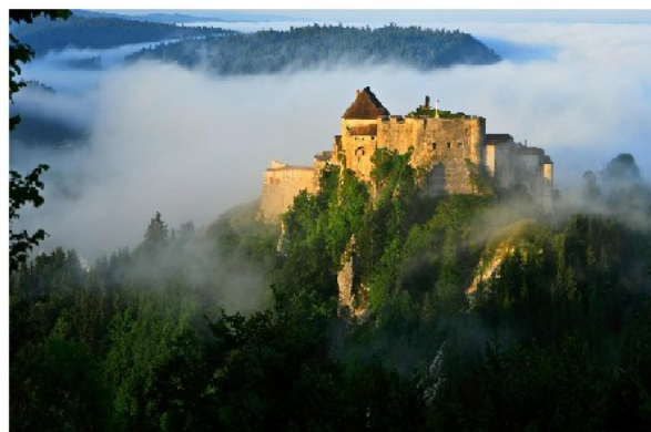
Le chateau de Joux

Le fort de Joux a été construit pendant le moyen-age. Il se situe pres de Pontarlier.