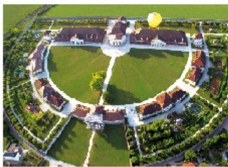
Les salines royales d'arc et senan