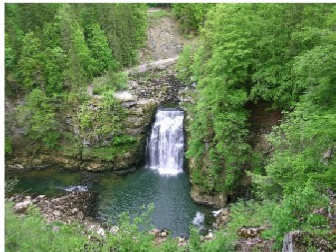
Le saut du Doubs

Le fleuve forme une boucle autour de la ville de Besancon, on l'appelle la boucle du Doubs.