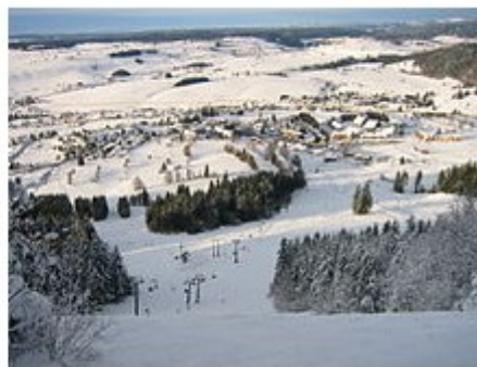
La station de ski de Metabief