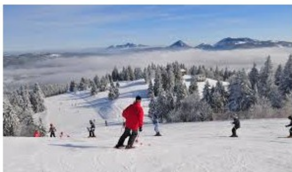
station de ski de Metabief

C'est une station de ski du haut Doubs, à 1000 mètres d'altitude située dans le massif du Mont d'or.