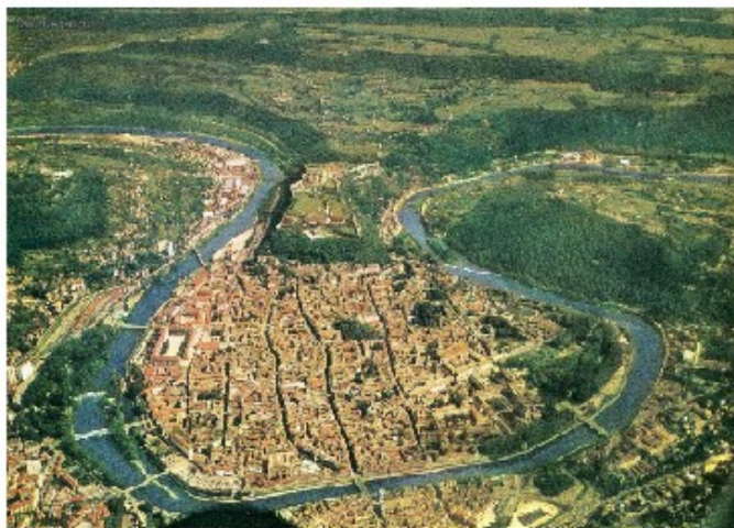
La boucle du Doubs

Le saut du Doubs est une chute d'eau de 27 mètres de haut dans le Doubs. Il se situe a la frontiere franco-suisse, dans la commune de Villers-le-lac.