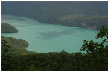
Le lac de Vouglan