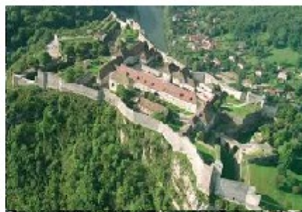
La citadelle de Besançon