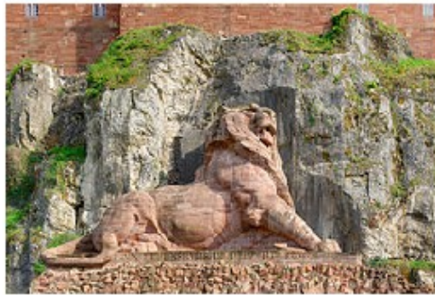
Le lion de Belfort.