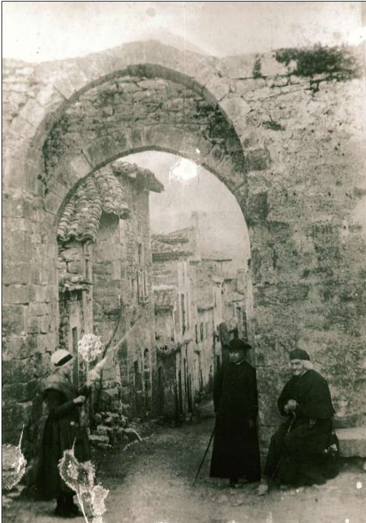
Après le livre sur le curé Nonorgues un ami m'a communiqué cette photo où l'homme est sur la droite devant une porte du village. Photo unique totalement émouvante. D'où la publication d'une deuxième édition.