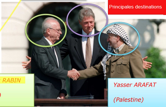
Yitzhak RABIN (Israël)