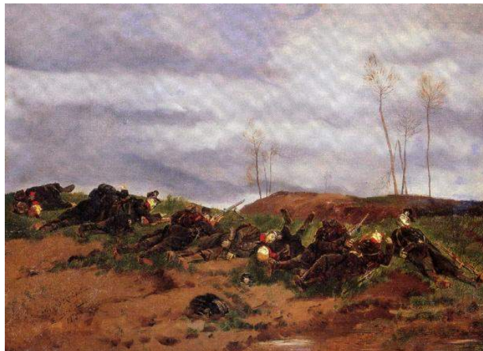
Un coup de mitrailleuse , Édouard Detaille

Avant même la fin du conflit, l'humiliation de la défaite suscita un désir de revanche militaire parmi les officiers français. S'ils acceptaient la capitulation, ces professionnels de la guerre estimaient avoir perdu une bataille qui pouvait être retournée en victoire si la France prenait le temps de se réorganiser. Pour eux, la Revanche était un devoir qu'ils pensaient pouvoir accomplir dans les deux ou trois ans qui venaient. Ce désir d'hommes gardant de la guerre des souvenirs cuisants d'infériorité militaire ou de trahison servit de point de départ au mouvement revanchiste qu'incarnèrent le général Boulanger, le sous-lieutenant Paul Déroulède et le peintre Edouard Detaille. Spécialiste de la représentation de la guerre de 1870, ce dernier est la figure emblématique d'un travail de mémoire mis au service d'une cause à laquelle il voue une partie de sa vie. Habitué du salon de Juliette Adam, égérie de la Revanche, il participa à la création du journal Le Drapeau (1881) et soutint la Ligue des patriotes dès sa création (1882).