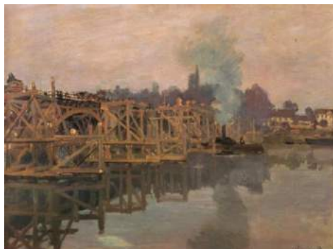
Argenteuil, le pont en reconstruction , Claude Monet