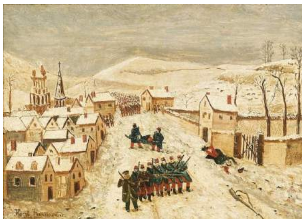
Paysage d'hiver avec scène de la guerre de 1870, Henri Rousseau