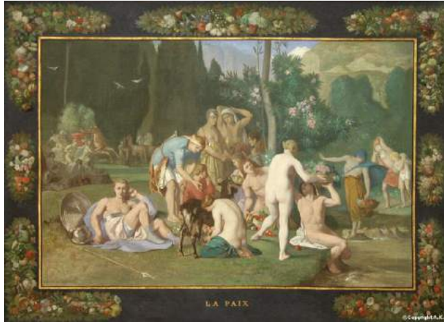
Entre art et nature, les bienfaits de la paix , Pierre Puvis de Chavannes