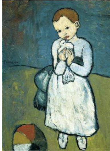
Enfant à la colombe, Pablo Picasso

Si le thème de la paix est peu prisé, il donne toutefois lieu à des réalisations fortes dans la période 1900-1914. En 1901, année emblématique dans notre perspective puisque c'est celle où fut décerné le 1 er prix Nobel de la Paix, quelques artistes se mobilisent : le Français Gauguin ( La paix en contrepoint de La guerre ), l'Espagnol Picasso ( Enfant à la colombe ) et le Belge Léon Frédéric ( L'âge d'or ) la peignent. La diversité des nationalités semblent garantir l'authenticité du désir de rapprocher les peuples. Avec Les représentants des puissances étrangères venant saluer la République en signe de paix (1907), Henri Rousseau exprime clairement son pacifisme. Besnard, en 1912 ( La paix par l'arbitrage ), tente encore de plaider à sa façon en faveur de la paix.