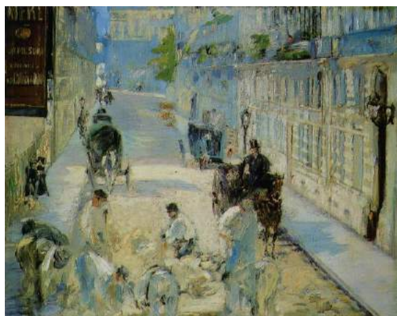
La rue Mosnier aux paveurs , Édouard Manet