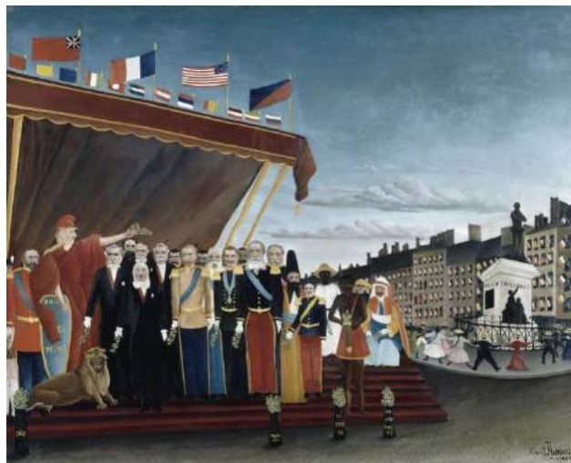
Les représentants des puissances étrangères venant saluer la République en signe de paix, Henri Rousseau

Si le thème de la paix est peu prisé, il donne toutefois lieu à des réalisations fortes dans la période 1900-1914. En 1901, année emblématique dans notre perspective puisque c'est celle où fut décerné le 1 er prix Nobel de la Paix, quelques artistes se mobilisent : le Français Gauguin ( La paix en contrepoint de La guerre ), l'Espagnol Picasso ( Enfant à la colombe ) et le Belge Léon Frédéric ( L'âge d'or ) la peignent. La diversité des nationalités semblent garantir l'authenticité du désir de rapprocher les peuples. Avec Les représentants des puissances étrangères venant saluer la République en signe de paix (1907), Henri Rousseau exprime clairement son pacifisme. Besnard, en 1912 ( La paix par l'arbitrage ), tente encore de plaider à sa façon en faveur de la paix.