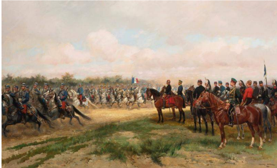
Défilé de cavalerie aux grandes manœuvres, Édouard Detaille.

Un tournant s'opère vers 1885 8 , date où disparaît De Neuville et ou, de façon emblématique, Detaille abandonne les sujets portant sur la guerre de 1870. Il en a fait le tour. C'est aussi le moment où le souvenir s'estompe ; le désir de revanche parfois s'étiolé. Ceux qui voulaient corriger la mauvaise copie rendue en 1871 voient leur vœu s'éloigner. Ils n'ont plus l'âge de l'accomplir. La Revanche devait s'opérer vite ; plus tard est trop tard pour eux. Dubois-Pillet et Jeannot quittent l'armée, se lancent dans une carrière de peintres et abandonnent toute représentation de la guerre au profit d'expressions de type « moderne » comme le postimpressionnisme pour le premier. Si elle doit se prendre un jour, la Revanche le sera par une nouvelle génération que leurs aînés se contenteront d'instruire pour leur éviter de répéter les erreurs passées. Ils s'ingénieront surtout à leur donner les outils de la confiance. Dans ce cadre, Édouard Detaille expose ses images d'une armée française réorganisée ( Défilé de cavalerie aux grandes manœuvres , 1880) et qui peut rêver de victoires ( Le rêve , 1888). Au public, il préfère désormais présenter la mémoire napoléonienne ( Charge de cavalerie. Vive l'Empereur ! en 1891 ou Les grenadiers à cheval à la bataille d'Eylau : hant les têtes ! en 1893) plutôt que le souvenir des défaites. La mémoire qu'il entretient ainsi « oublie » désormais les souvenirs de 1870 tout en préservant l'idée de reprendre les armes contre les Prussiens.