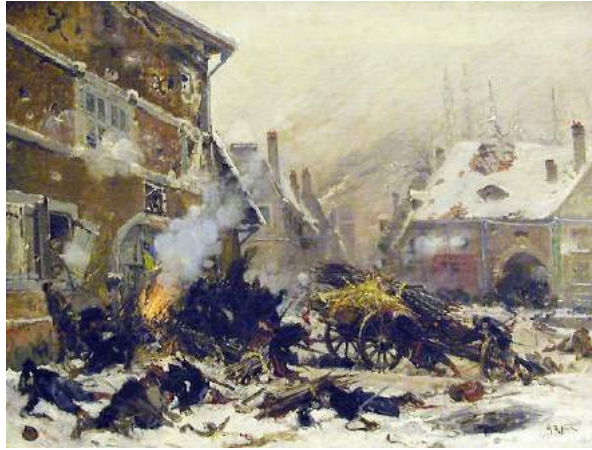
Attaque d'une maison barricadée, Villersexel, De Neuville