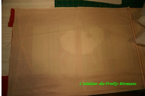
Vue du top (et des liens) par transparence.

Placer le tissu de fond endroit sur endroit sur le top, puis superposer le molleton sur le tout comme indiqué ci-dessous :