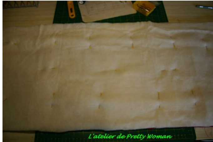
Superposition du molleton.