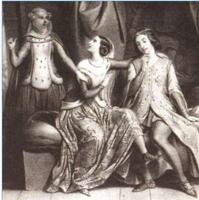
Le roi Louis IX, Marguerite de Provence et en arrière la reine Blanche de Castille [tableau de Eugène Delacroix 1839 coll. B.N.F]

Pourtant, entre-temps, il a eu le temps d'épouser la ravissante et fort vertueuse Marguerite de Provence fille de Raymond Béranger IV de Provence.