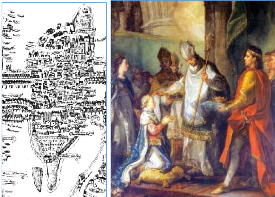
L'île de la Cité Paris et sacre de Saint-Louis [Charles Amédée Philippe van Loo XVIIIe siècle]

Il est également réformateur et souhaitera léguer son royaume dont les sujets seront soumis à un pouvoir beaucoup plus juste que du temps de ses prédécesseurs. Il renouvelle alors la « Quarantaine-le-roi » introduite par les baillis et les prévôts et interdit l'ordalie en instituant la « supplicatio » qui consiste à pouvoir faire appel au roi dans l'amendement d'un jugement. Il offrira, en outre, une monnaie unique à son royaume et institue le Parlement et la Cour des Comptes . Il fera punir le blasphème, les jeux d'argent, les prêts usuriers, la prostitution et fera construire afin d'y abriter les reliques du Christ : la Sainte-Chapelle à Paris tout en s'évertuant à convertir les Juifs de France.