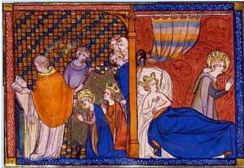
Mariage de Louis et Marguerite de Provence et abstinence du Roi [miniature de Guillaume de Saint-Pathus – Vie et Miracles de Saint-Louis]