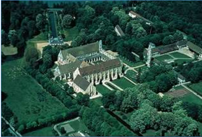
Abbaye de Royaumont Asnières-sur-Oise

Il fonde, dans les premières années de son règne, l'abbaye de Royaumont à Asnières-sur-Oise conformément au vœu de son père Louis VIII de voir un monument dédié à la Vierge Marie et affilié à Saint-Victor de Paris.