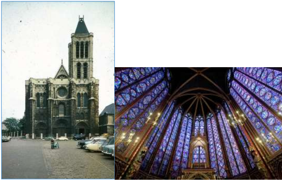
Cathédrale St-Denis Paris et la Sainte-Chapelle île de la Cité