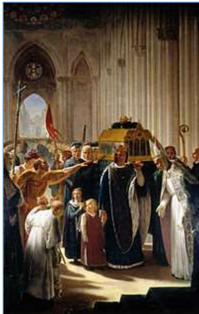
Philippe III – Le Hardi – apportant à St Denis les reliques de Saint-Louis 22.5.1671 [tableau du XVIIIème siècle]

Ses restes furent inhumés à Saint-Denis, le 22 mai 1271 , cathédrale qu'il avait fondé.