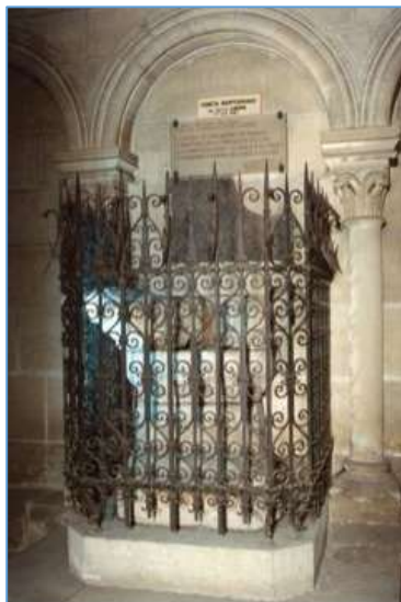
Les fonts baptismaux, toujours conservés dans la collégiale Notre-Dame, protégés depuis le XIX e siècle par une solide grille de fer forgé

Sur les hauteurs de Poissy, la tour de Béthemont renforçait encore les défenses de la ville et un peu plus loin se tenait la Maladrerie ayant laissé son nom à l'un des quartiers de la ville. Celle-ci abritait les lépreux, nombreux à cette époque.