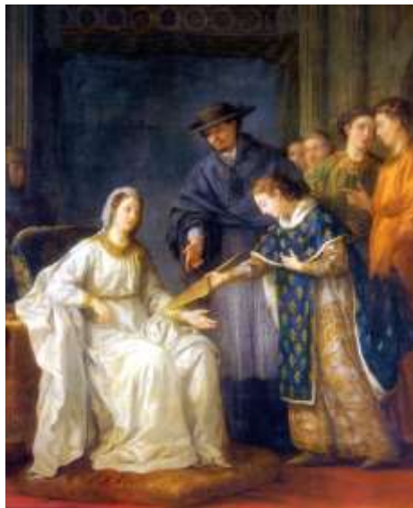
Louis IX remet la régence à sa mère [Joseph-Marie Vien chapelle Ecole-Militaire Paris]

Poissy n'est pas une grande ville à l'époque de notre bon roi mais est le centre d'une grande châellenie comprenant de nombreux villages jusqu'à Maule dans la vallée de la Mauldre. C'est ainsi que les villes d'Achères, Le Mesnil-le-Roi, Maisons-Laffitte et bien d'autres encore sont dans la censive de cette ville. Un grand marché aux bestiaux se tient régulièrement, privilège institué par le grand-père du futur Saint-Louis : Philippe Auguste, qui avait également octroyé à la ville une charte de commune en 1200. Poissy appartenait au domaine royal depuis Hugues-Capet et donnée par Louis VIII (père de Saint-Louis) de la volonté de ce même roi : Philippe-Auguste. Le père de Louis IX meurt le 14 juillet 1223 .