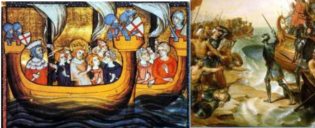
Départ d'Aigues-Mortes [miniature] et Arrivée à Damiette (Égypte) [par Georges Rouget 1839]

La fin de son règne : Parti de Cagliari le 15 juillet 1270 , la flotte de Louis IX arrive devant Tunis le 18 juillet. Le Sultan a préparé sa ville à subir le siège des croisés. Malheureusement la chaleur et le manque d'eau potable contribuent à favoriser le développement de maladies létales à cette époque. Elles envahissent le camp du roi et l'armée va être victime ainsi que le roi lui-même de la dysenterie. Son