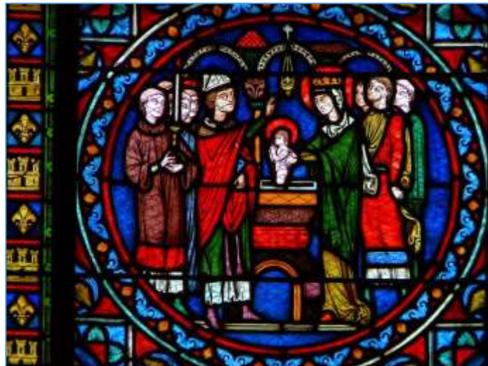
Baptême de St Louis – collégiale de Poissy – sera canonisé en 1297 -

Cet enfant va avoir un destin exceptionnel et tout au long de son règne signera les actes de sa vie de « Louis de Poissy » en souvenir des grâces reçues le jour de son baptême en cette ville.