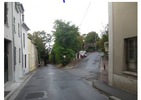
◀ La Cavée, Paul Louchet 1900