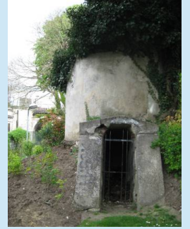
Petit tour d'horizon rapide