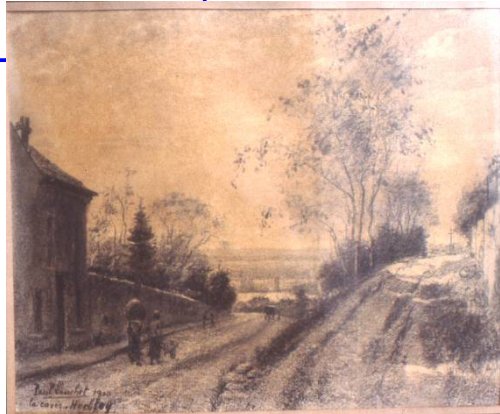
... au sud