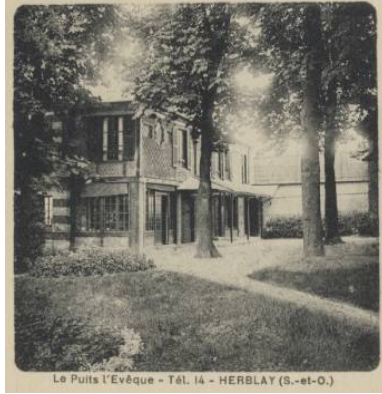
7- au nord...

Avant la RPA les Erables, la "Maison Brunet" s'est attribué un temps la dénomination de "Puits l'Évêque"