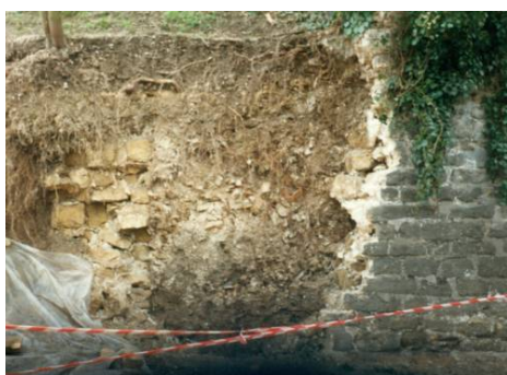
Le vieux mur (le montage photo donne un aspect courbe)

... Mais ci-dessous s'aperçoit un mur de construction soignée, enfoui dans les remblais de la pente.