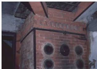
Sans doute un des premiers chauffages par le sol...