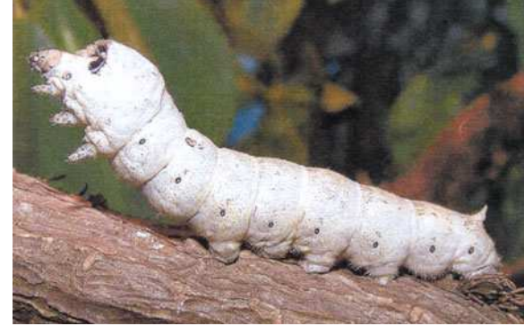
VER À SOIE