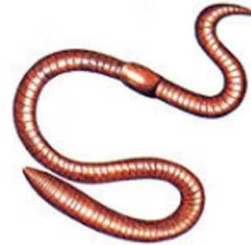
VER DE TERRE