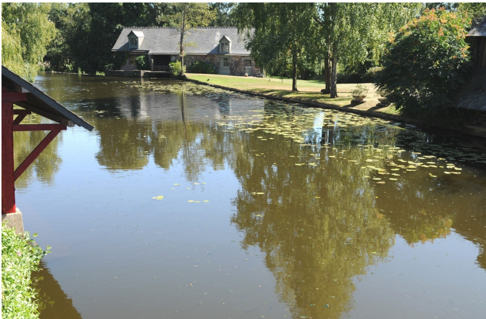
Rivière du Meu, côté Est - rive Nord / rive Sud - plan rapproché. Lavoir à gauche