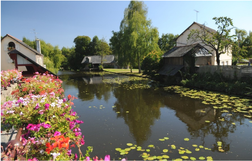
Rivière du Meu, vue depuis le pont, côté Est - rive Nord / rive Sud. Lavoir à gauche