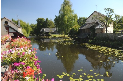
Rivière du Meu

le lavoir, rivière du Meu, boulevard du colombier