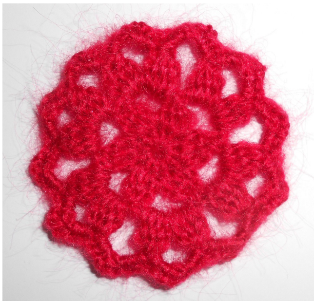
Ce granny a été réalisé en Angel de Bergère de France fil double au crochet n°2,5, le granny obtenu fait 6 cm de diamètre.