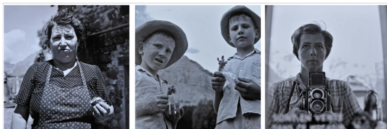
© Vivian Maier / Collection Vivian Maier et le Champsaur

« Sur les traces de Vivian Maier », présente l'œuvre de la photographe américaine en lien avec ses origines françaises, situées dans le Champsaur. Conjointement, une exposition collective sera construite avec la participation de photographes émergents pour faire résonance avec cette mise à l'honneur.