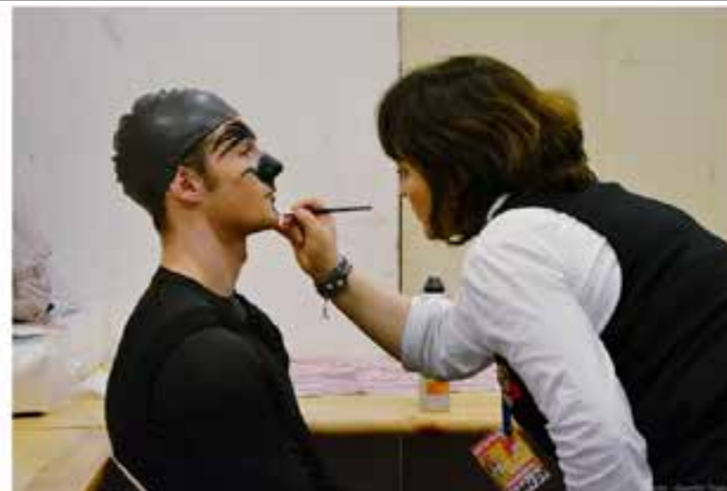
En coulisse, c'est l'heure d'ajuster le maquillage.

La salle est comble. Le spectacle commence enfin. Pendant plus d'une heure et demi se succèdent les numéros. Tous les handicaps sont présents, on ne cherche pas à les masquer : ils sont exploités. C'est de cette manière que s'exprime tout la singularité de la représentation. Des fauteuils roulent déguisés en robots, une danseuse utilise les reliefs de ce fauteuil pour déclarer son amour, la différence devient une force unique.