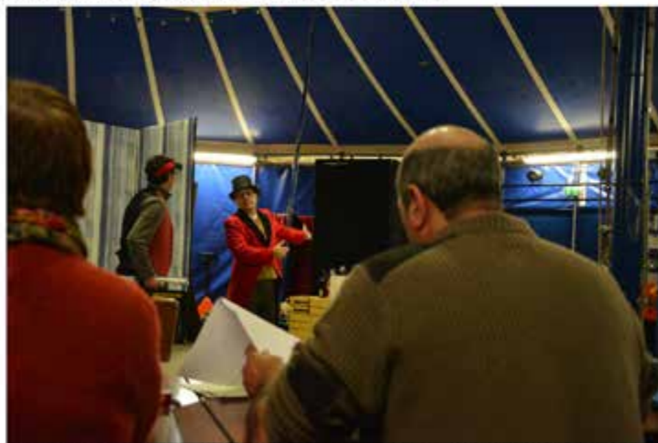
Sous l'œil vigilant du metteur en scène, les acteurs répètent.

Monsieur Loyal est fou amoureux de la dompteuse Rosine, interprétée par Jeanne, étudiante souriante, atteinte de myopathie. Hélas, le directeur du cirque, Bartolo, entend lui aussi la prendre pour épouse, malgré la différence d'âge et l'indifférence de celle-ci à son égard. La partie théâtrale est librement inspirée du Barbier de Séville de Beaumarchais, elle servira à articuler des numéros de cirque, de danse et de chant. Le défi, selon Jeanne, est de dépasser le handicap pour produire de l'émotion et un spectacle de qualité.