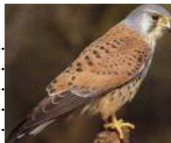
Yaka, le faucon de l'association "L'Echo des vallons"