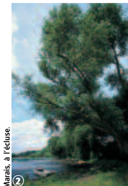
Marais, à l'écluse.

En période de chasse, l'accès peut être réglementé : se renseigner en mairie sur les calendriers de chasse. Meilleure période : d'avril à octobre.