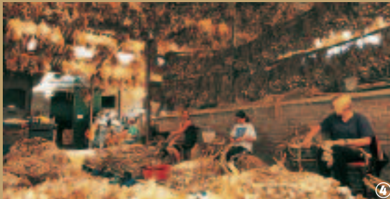
Arleux, Foire à l'ail.

la main. Mais la saveur unique s'obtient lors du séchage : contrairement à la culture de l'ail dans le midi, l'ail d'Arleux n'est pas séché au soleil. Il est placé dans un fumoir où une lente combustion de sciure, paille et tourbe, lui procure un arôme subtil et une coloration rousse exceptionnelle. Cette opération de fumage est répétée une dizaine de jours après chaque récolte.