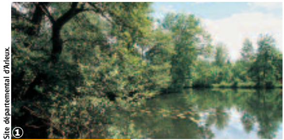
Site départemental d'Arleux.

Une sélection des 30 plus belles balades