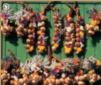
Arleux, Foire à l'ail.

Porter les 2 litres d'eau salée à ébullition. Eplucher l'ail ainsi que les légumes, en prenant soin de supprimer les germes de chaque gousses d'ail. Mettre les légumes dans l'eau à ébullition et laisser cuire à petit feu 2 bonnes heures. Au bout de ce temps, mixer la soupe. La verser dans la soupière et ajouter la crème fraîche. Servir immédiatement accompagné de pain grillé.