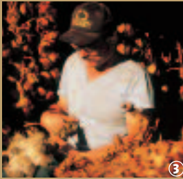
Arleux, Foire à l'ail.

La culture de cette plante résulte d'un savoir-faire ancestral ; les différentes étapes : égoussage, plantation, arrachage, tressage, se font à