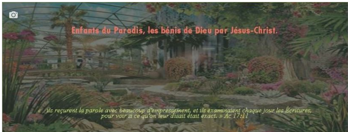
Figure 1: page facebook de Enfants du Paradis

Enfants du Paradis est né à un moment où étions déjà lancé dans l'écriture. Notre carrière d'écrivain commence en 2001 ; mais est stoppée par les études universitaires, par les occupations sociales et surtout par le sentiment que le meilleur moment n'est pas encore venu.