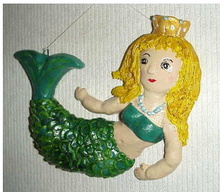
Arielle la sirène