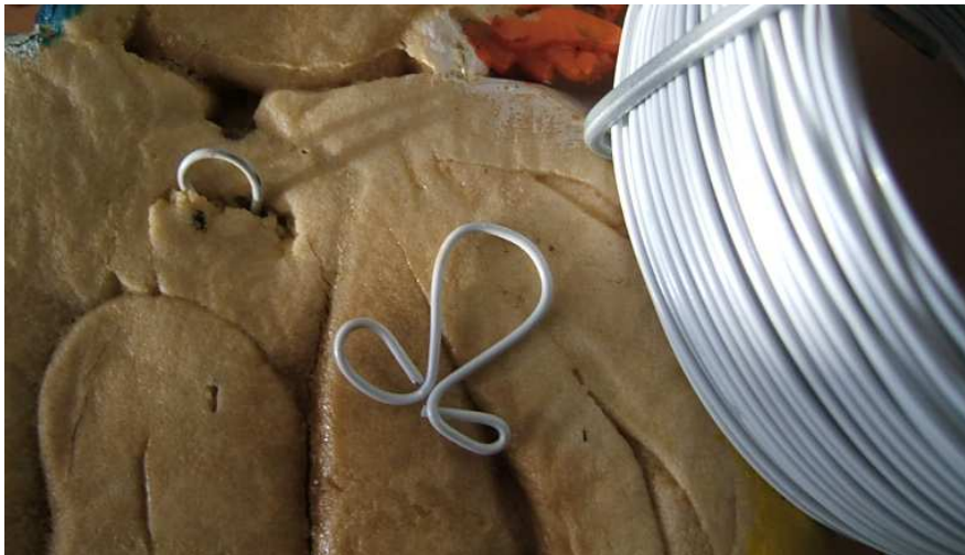
attache réalisée en fil de fer de fleuriste plastifié

Pour suspendre vos pâtes à sel, pensez à introduire dans votre modelage, dès le début de sa réalisation une attache pour pouvoir ensuite le suspendre. Réalisée avec du fil de fleuriste plastifié ou tout simplement un trombone, vous prendrez soin d'enrouler la partie qui dépasse de papier aluminium pour la protéger durant la cuisson.