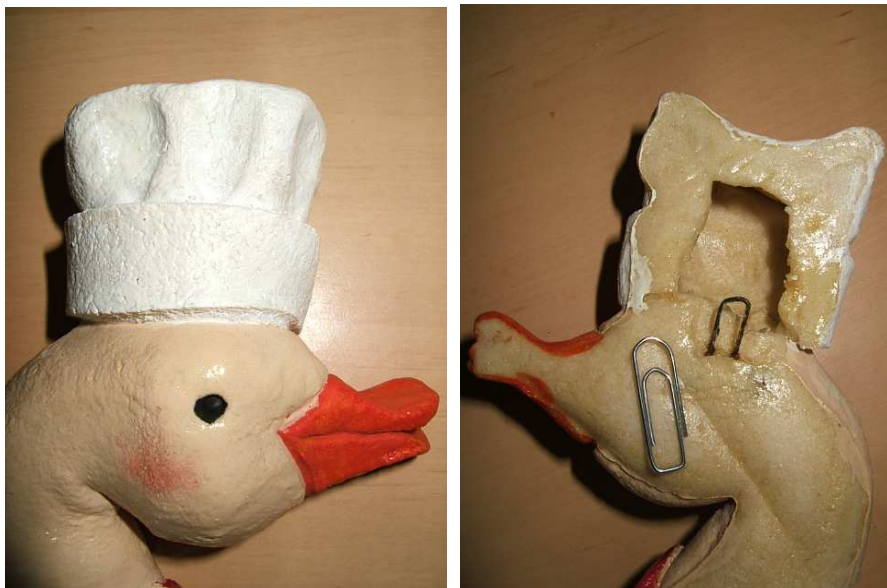
attache réalisée à l'aide d'un trombone