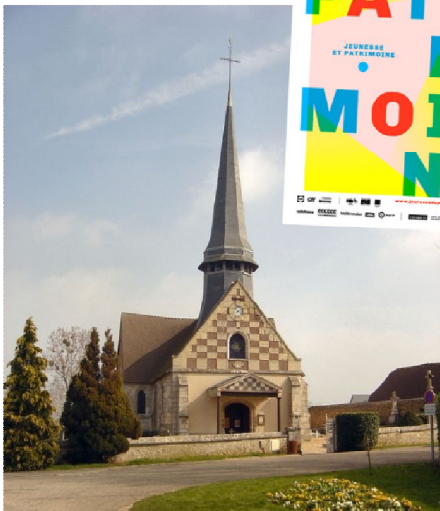
L'église de Guichainville

Le samedi matin 16 septembre, la commune de Guichainville inaugurera une plaque « Ecole François et Monique BIBES » en présence de l'ancien maire et de son épouse qui ont tant fait dans et pour l'école de ce village.